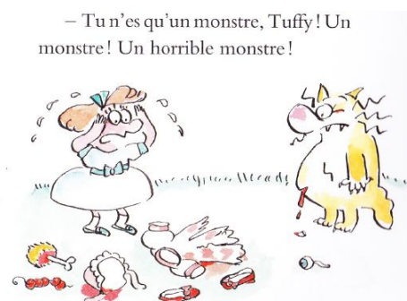
Figure 2 - L'identification des sentiments de Mélanie dans le chapitre 9