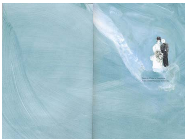
Double page [4-5]