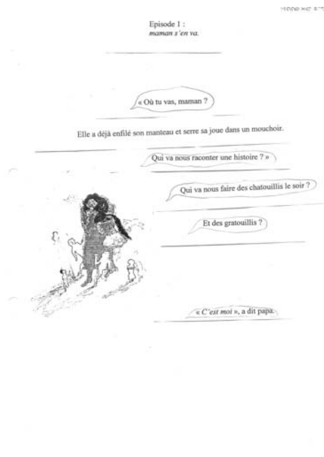
Reproduction d'une des copies des élèves

Les élèves ont, sous les yeux, le dessin de la page 7, sans texte. La tâche consiste à disposer les phrases du texte, découpées en bandelettes, sur la page. Pour mener à bien cette tâche, il leur faudra, entre autre, identifier les guillemets et distinguer la parole du narrateur et les paroles rapportées des personnages. On le voit, la tâche est construite sur une des spécificités de l'écriture de l'auteure. La distribution du texte sur l'espace blanc contribue à représenter l'espace temps du récit. Ici, les paroles des enfants, regroupées autour de la maman, déterminent le mouvement de départ de la maman et nourrissent la tension dramatique causée par ce départ. L'essaim inquiet se presse autour de la reine mère, muette. Ce n'est pas la mère qui répond aux questions qui lui sont adressées (accrochées littéralement), mais le père. La réplique de ce dernier, brève, contraste avec le foisonnement de l'essaim. Le temps du verbe de parole, le passé composé, ajoute à l'accompli d'une réponse qui tombe comme un couperet.