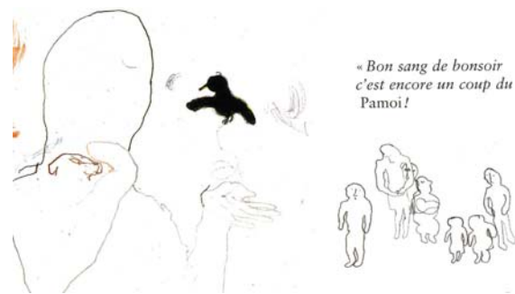
Détails de la double page [26-27]

Le trait du dessin est hésitant, schématique, abstrait, et empêche l'illusion référentielle. Les personnages sont moins reconnaissables par une identité de trait que par la couleur et le placement sur l'espace de la double page. On reconnaît un bouquet d'enfants dans le détail de la double page [4-5] ci-dessus. Dans le détail de la double page [26-27] ci-dessus, on identifie le rapport de force qui oppose à l'avant-plan l'autorité du père omnipotent et à l'arrière-plan l'attente contrite du groupe des enfants.