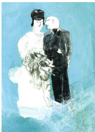
Détails de la double page [4-5]